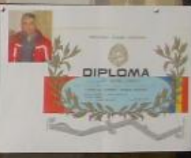
Expoziție de carte și fotografii Canal Dunăre-Marea Neagră 1984-2014