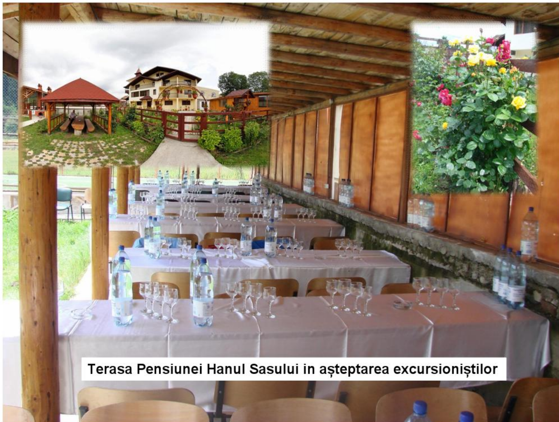
Terasa Pensiunei Hanul Sasului in aşteptarea excursioniştilor