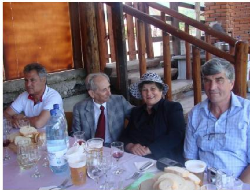
Picnic -22.06.2014 Pensiunea Hanul Sasului- Lerești