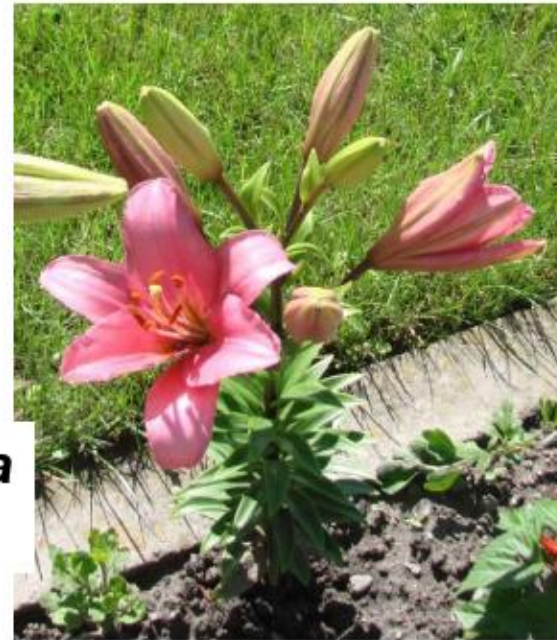
Mănăstirea Aninoasa 22.06.2014