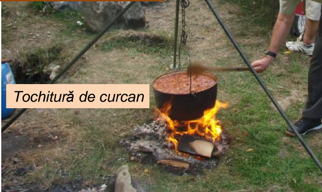
Tochitură de curcan