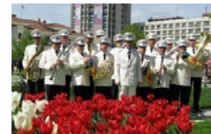
Fanfara "Argeșul" a Teatrului "Alexandru Davila"

Fanfara "Argeșul" a Teatrului "Alexandru Davila" continuă tradiția Muzicii militare din garnizoana Pitești care la 01 ianuarie 2006 și-a luat rămas bun de la locuitorii orașului și a fost redistribuită altor garnizoane .Fanfara reunește 15 muzicieni profesioniști cu studii de specialitate și cu o ținută (uniformă) ce le permite să participe în județ și nu numai, la desfășurarea unor activități specifice: