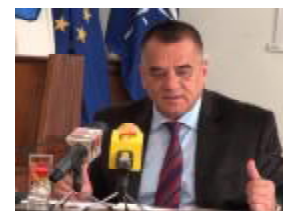
CORNEL IONICĂ Primarul municipiului Pitești