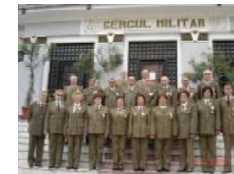
Asociația Culturală „Mihai Viteazul Corul Veteranul Militar"

Fanfara "Argeșul" a Teatrului "Alexandru Davila" continuă tradiția Muzicii militare din garnizoana Pitești care la 01 ianuarie 2006 și-a luat rămas bun de la locuitorii orașului și a fost redistribuită altor garnizoane .Fanfara reunește 15 muzicieni profesioniști cu studii de specialitate și cu o ținută (uniformă) ce le permite să participe în județ și nu numai, la desfășurarea unor activități specifice: