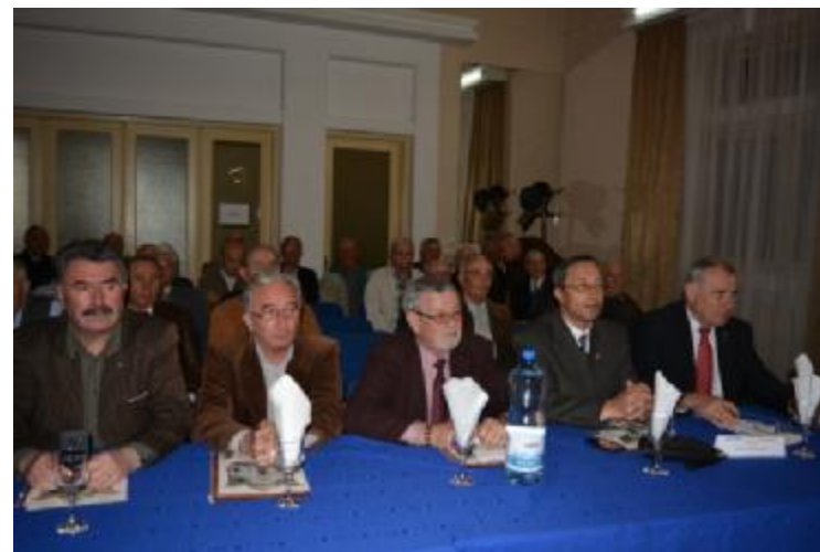
Colaborare excelentă cu structurile administrației locale și instituțiilor de cultură