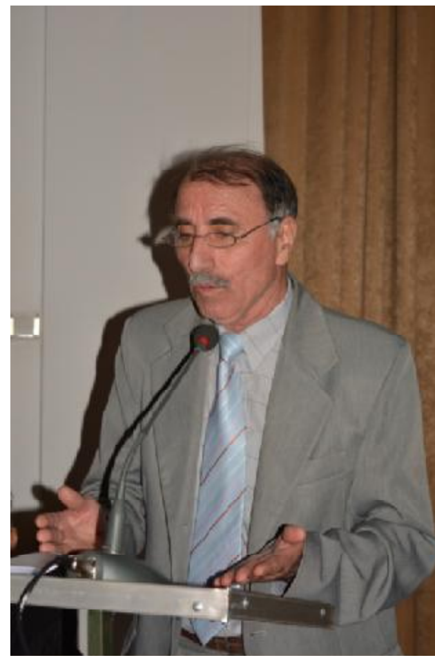
Mandu Vasile Corul Veteranilor