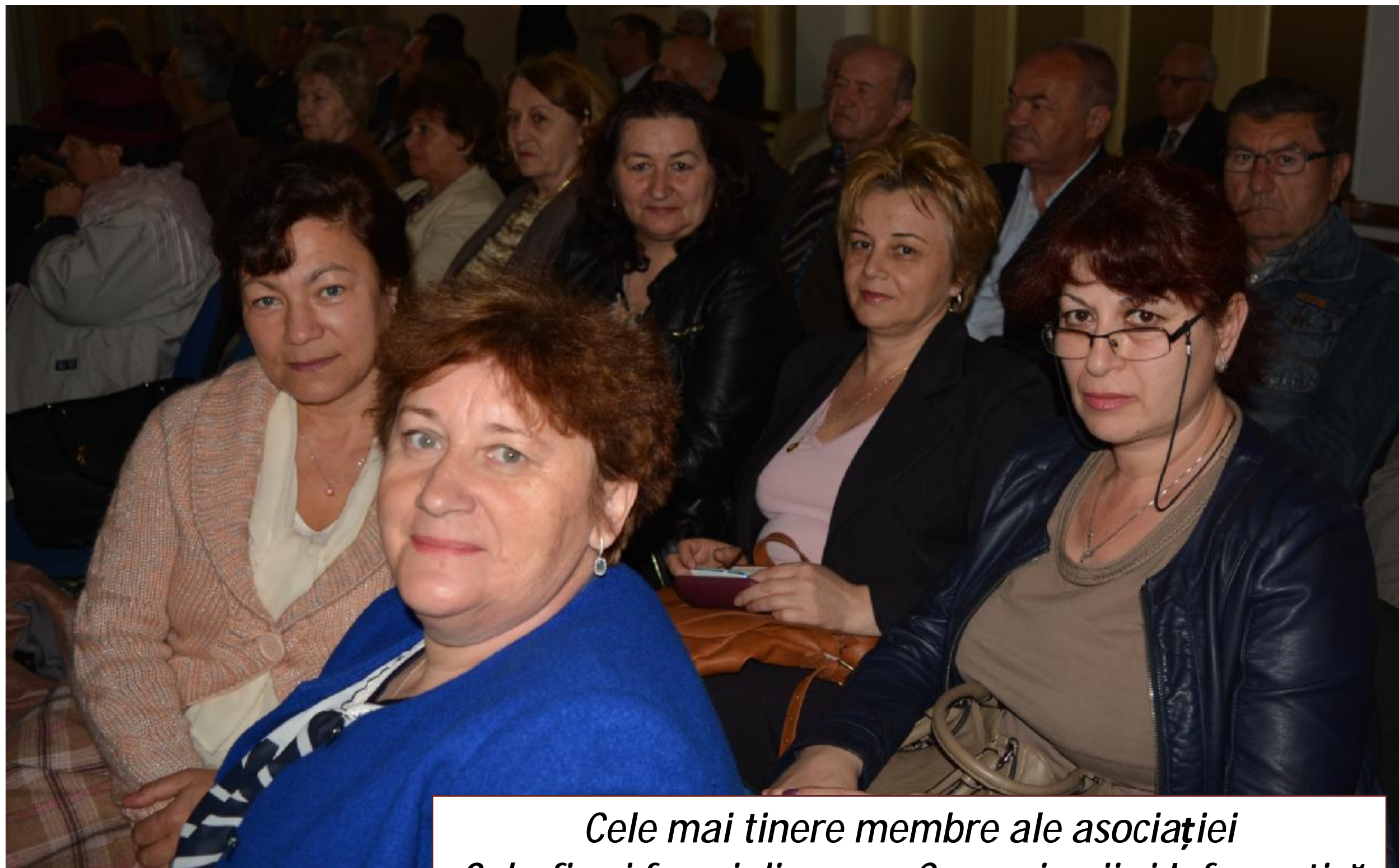
Cele mai tinere membre ale asociației Subofițeri femei din arma Comunicații și Informatică