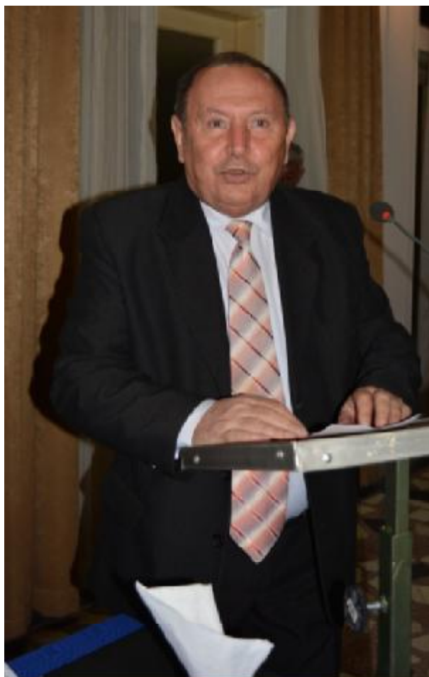
Col.rtr. Cruceană Mihai Președintele