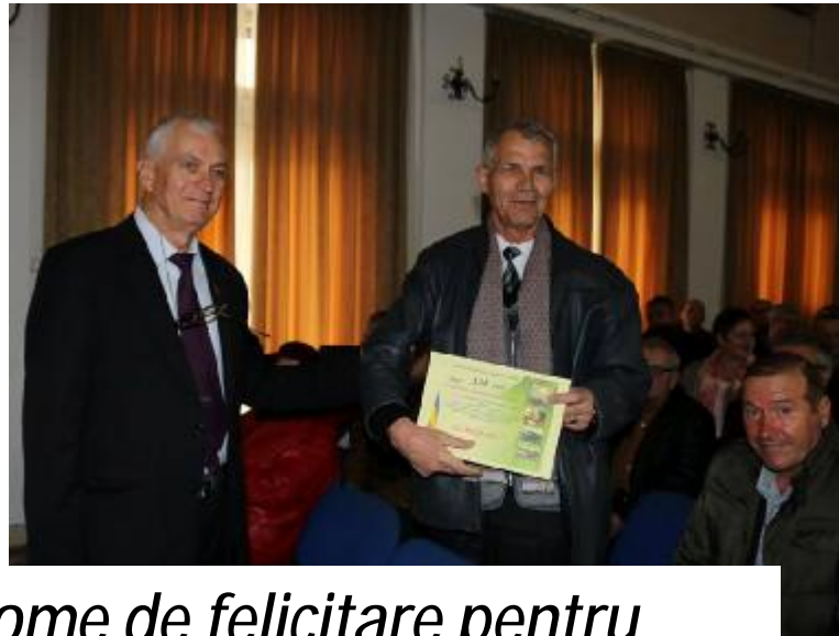
Mesaje și diplome de felicitare pentru artileriști, veterani militari și cerceași militari