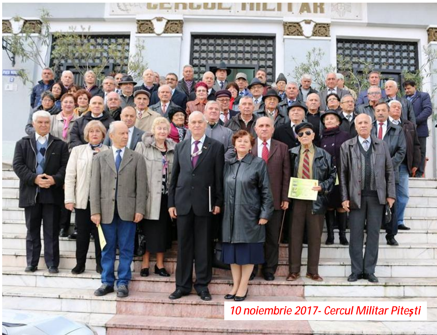
10 noiembrie 2017- Cercul Militar Pitești