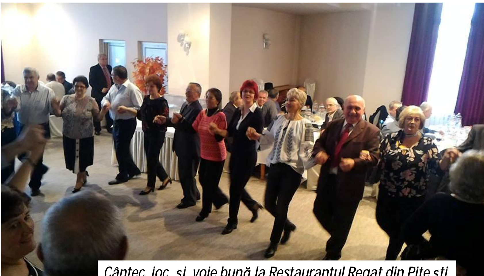
Cântec, joc și voie bună la Restaurantul Regat din Pitești