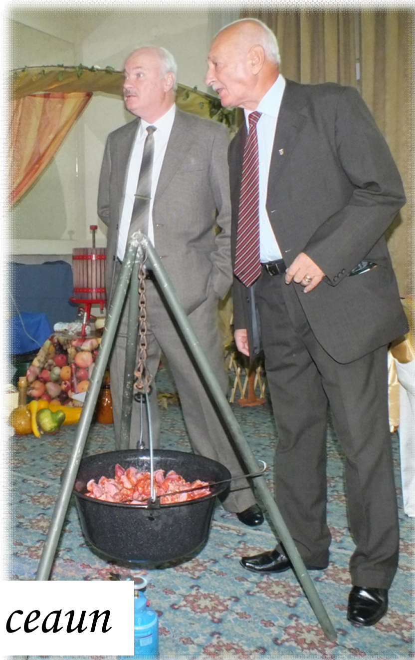
Pastramă la ceaun