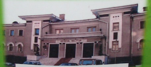
Cercul Militar Pitești