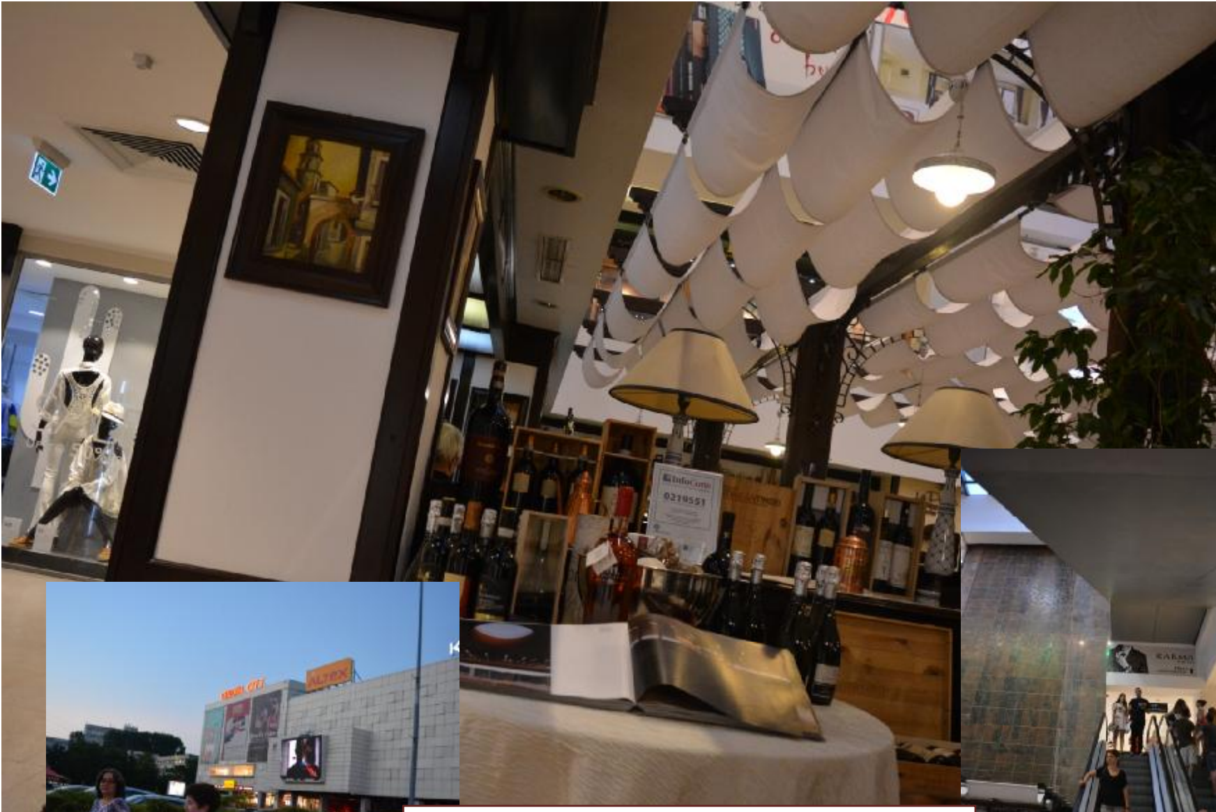
Vizită la complexul Comercial Center din municipiul Iași