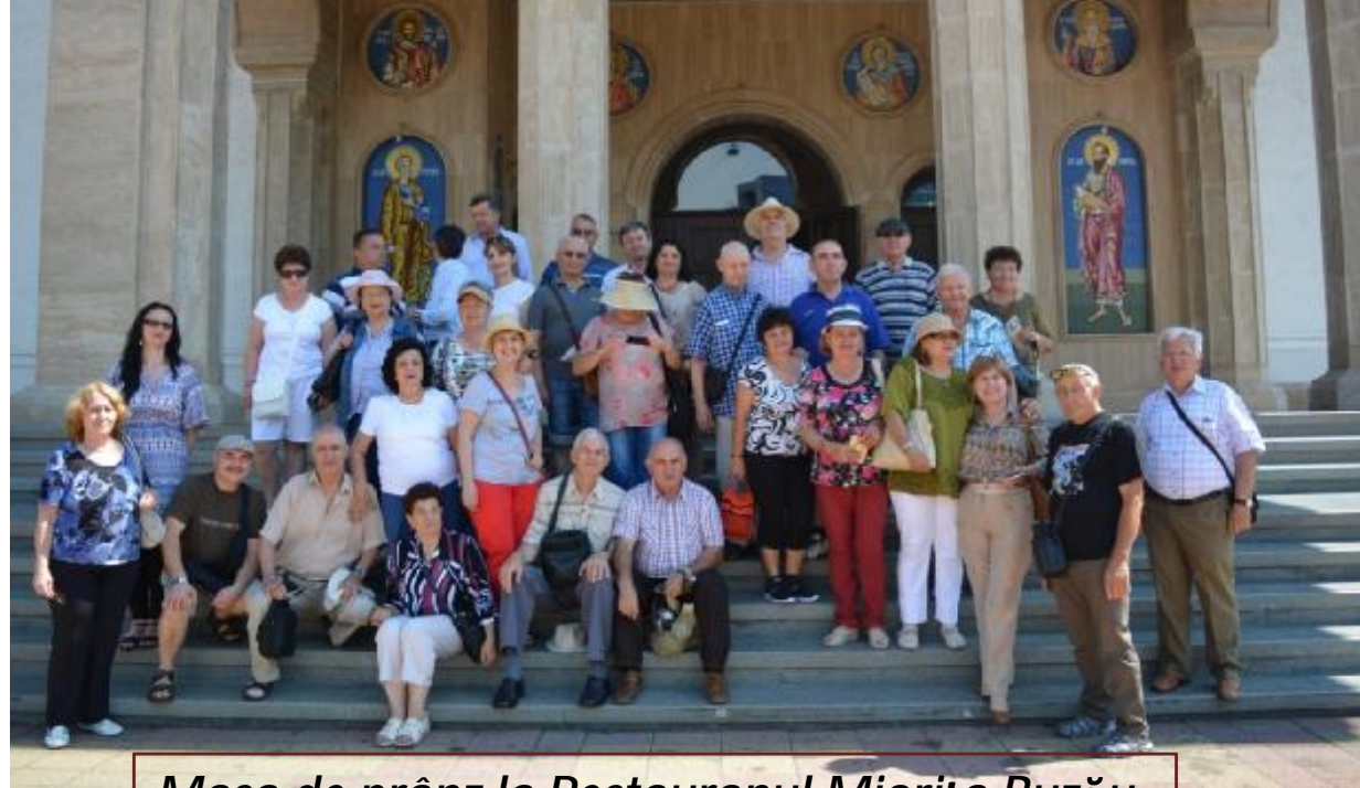
Masa de prânz la Restaurantul Miorița Buzău