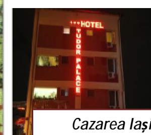
Cazarea Iași Hotel Tudor Palace