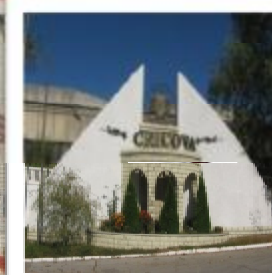
Beciurile de Vin Cricova