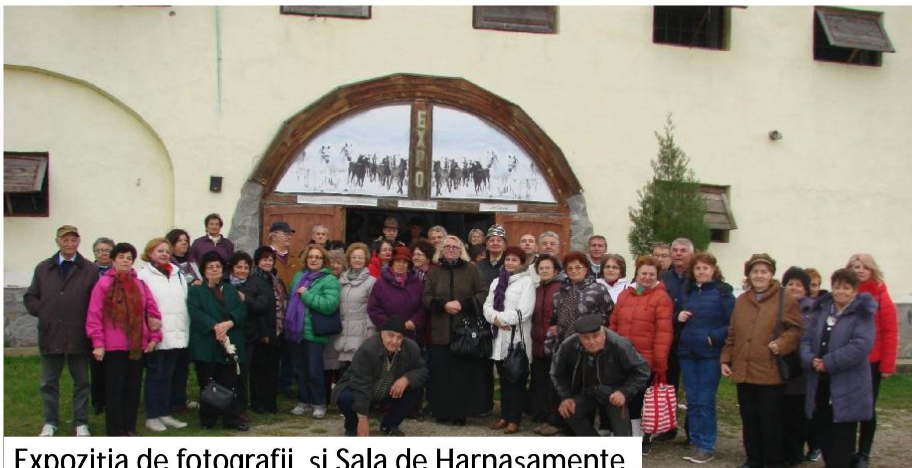
Expoziția de fotografii și Sala de Harnașamente