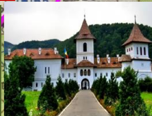
Mănăstirea Sâmbăta de Sus

AUTOCAR 57DE PERSOANE (TOTAL KM-540 PREȚ /KM-7 lei