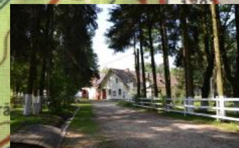
Herghelia "Sâmbăta de Jos"