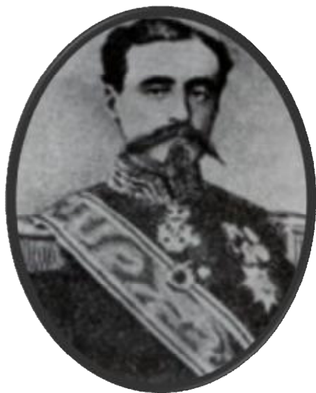
Generalul Ion Emanoil FLORESCU (30.05-30.08.1860, 21.04.1864-01.05.1866)

1859, 12/24 noiembrie – Prin Înaltul Ordin de Zi nr. 83 al domnitorului Alexandru Ioan Cuza este înființat Statul Major General.