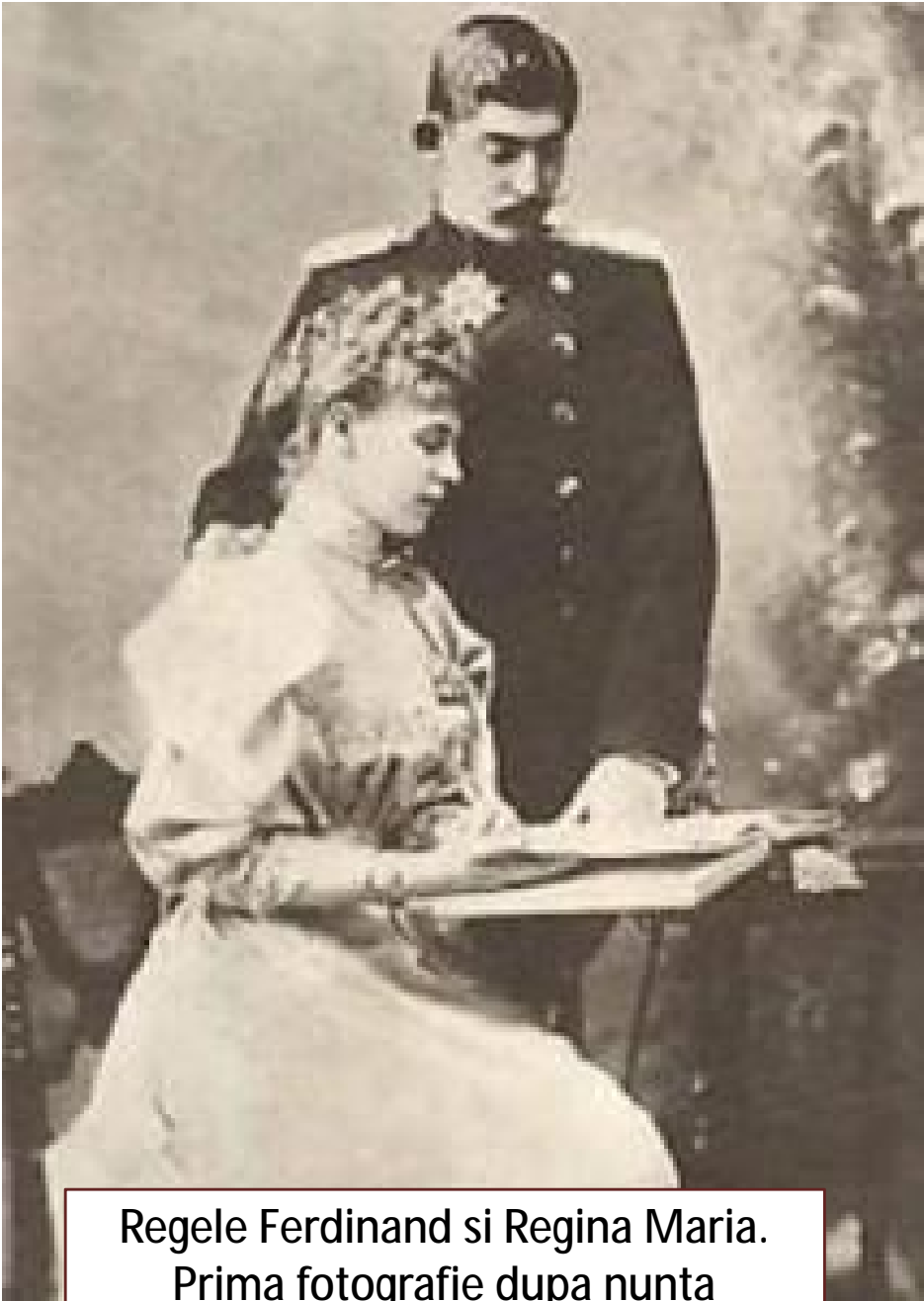
Regele Ferdinand si Regina Maria. Prima fotografie dupa nunta