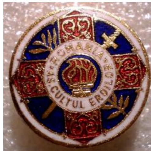
INSIGNA ROMANIA ASOCIATIA CULTUL EROILOR