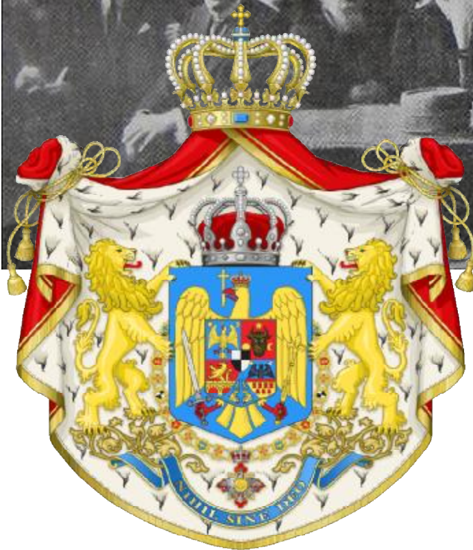
1918 Regele Ferdinand vorbind în fața primului Parlament al României Mari