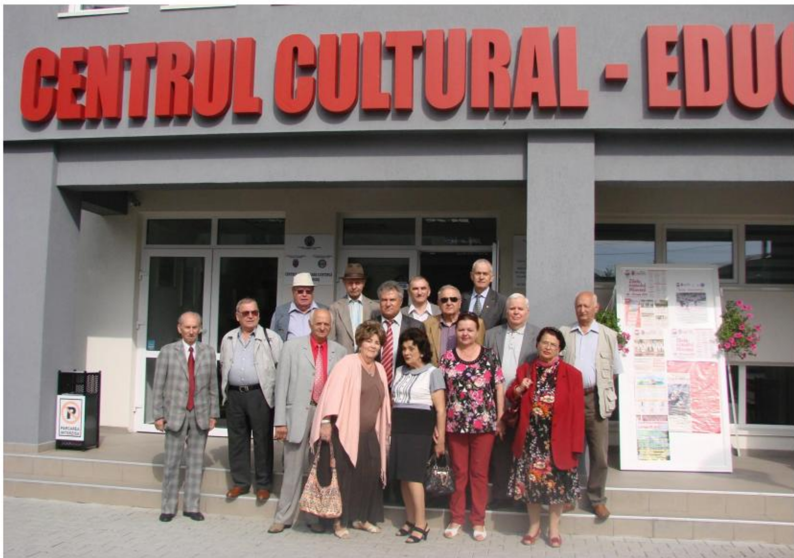
Delegația Asociației Județene Argeș Basarab I a CMRR care a participat la simpozion