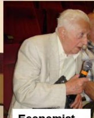
Economist Ion Dumitru