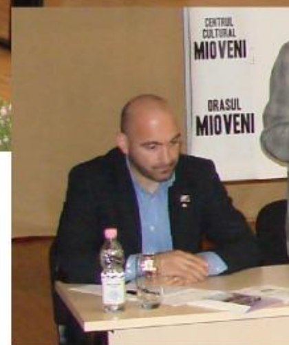
Reprezentantul Asociațiilor Nationale a Agențiilor de Turism