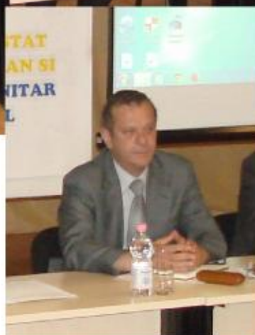
Reprezentantul Autorității Naționale de Turism