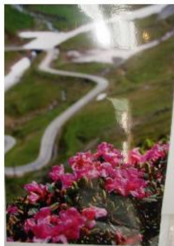
Prof.univ.dr. Radu Gava „Flora Montană în fotografie”