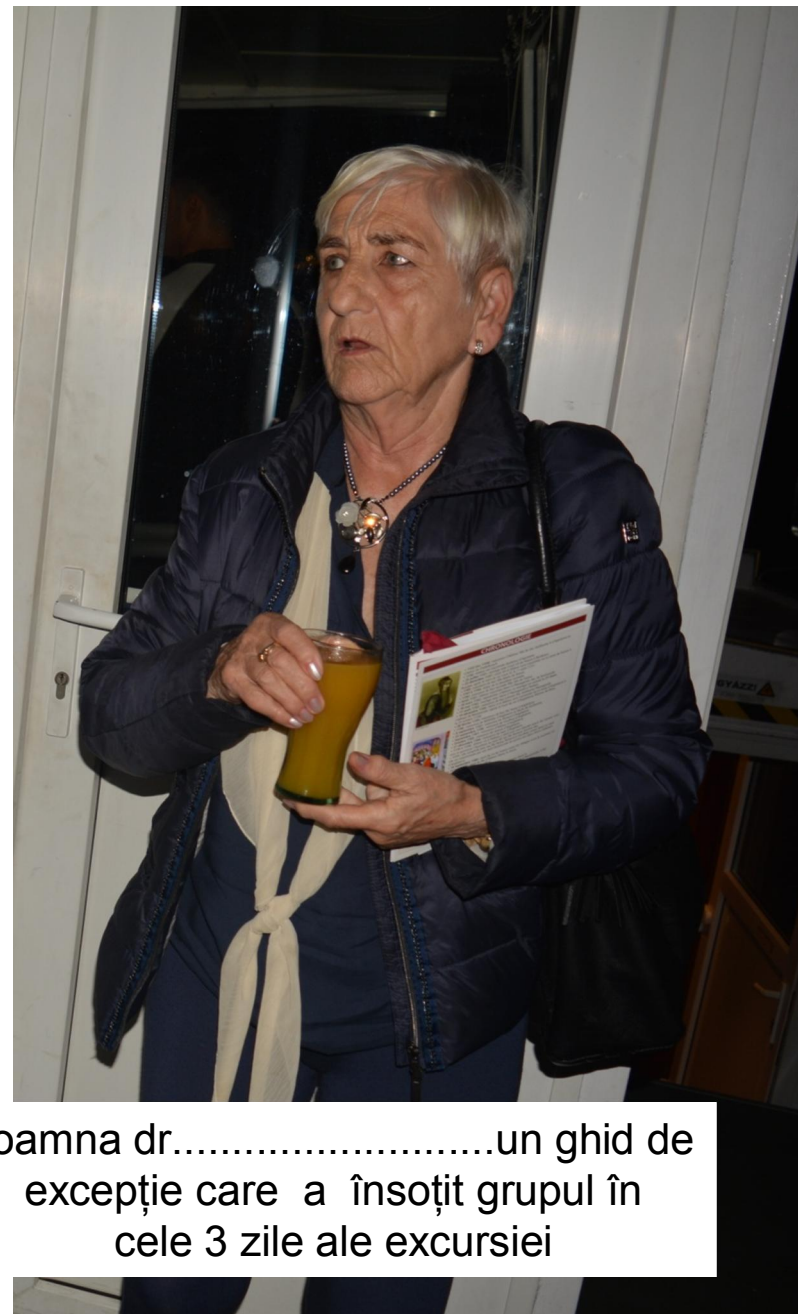
Doamna dr.....un ghid de excepție care a însoțit grupul în cele 3 zile ale excursiei