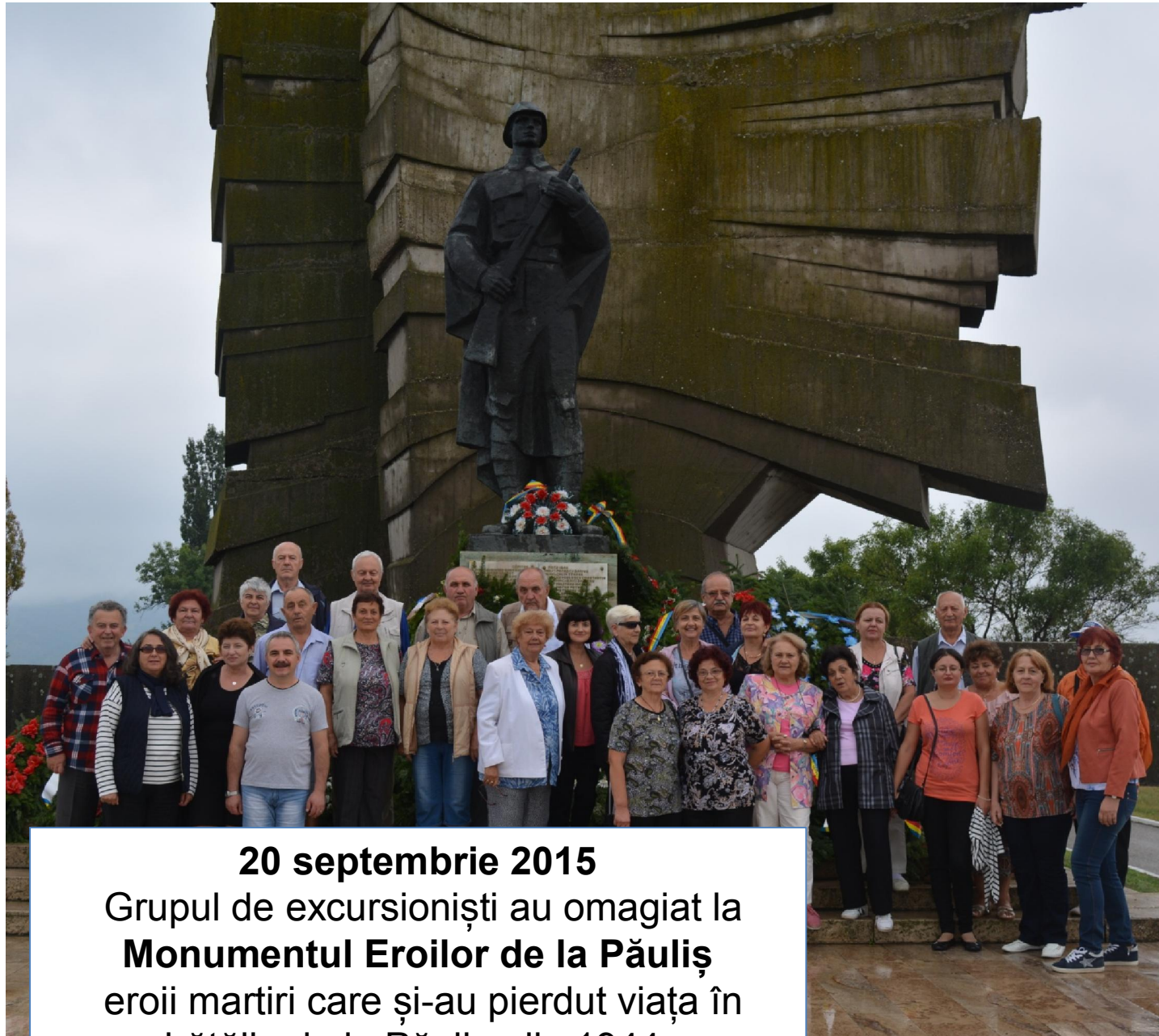
20 septembrie 2015 Grupul de excursioniști au omagiat la Monumentul Eroilor de la Păuliș , eroii martiri care și-au pierdut viața în bătălia de la Păuliș, din 1944.