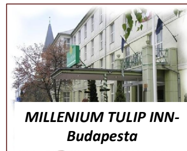
MILLENIUM TULIP INN- Budapesta