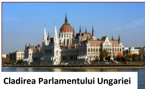
Cladirea Parlamentului Ungariei

Data limită pentru înscriere – 25 AUGUST 2015