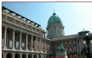
Palatul Regal din Budapesta