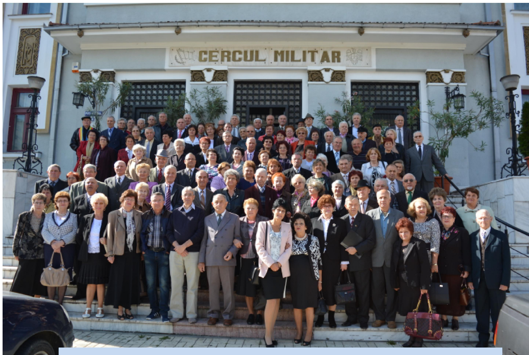
1 Octombrie 2015- Ziua Persoanelor Vârstnice