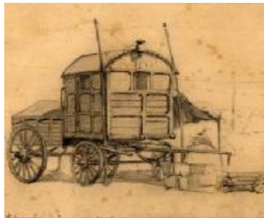
Telegraf de campanie –1877 Desen în creion de SAVA HENȚIA