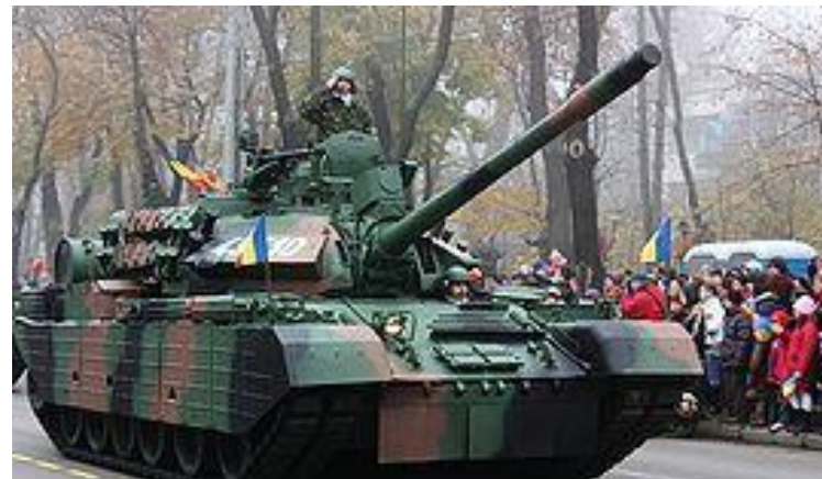
Tancul TR-85 M1 „Bizonul” fabricat în România