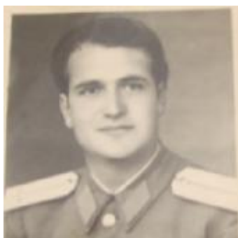
1953-Comandant de pluton în Garnizoana Topraisar